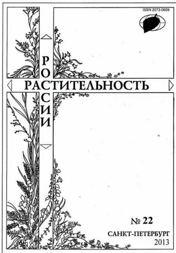
Главный научный журнал геоботаников России

черничник, сосняк зеленомошный, дубняк снытевый и т.д. – можно было установить непосредственно в поле. Причем для этого не нужно было знать все виды этих растительных сообществ, достаточно было различать среди них только наиболее распространенные, имеющие высокое обилие.